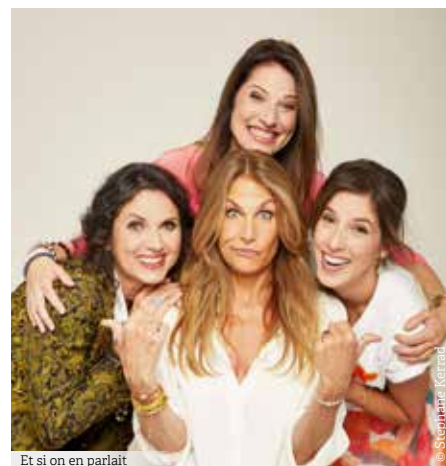
Et si on en parlait