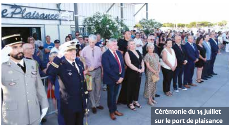
Cérémonie du 14 juillet sur le port de plaisance