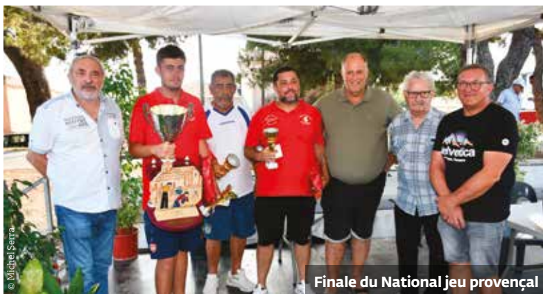
Finale du National jeu provençal