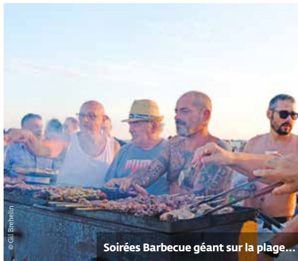
Soirées Barbecue géant sur la plage...