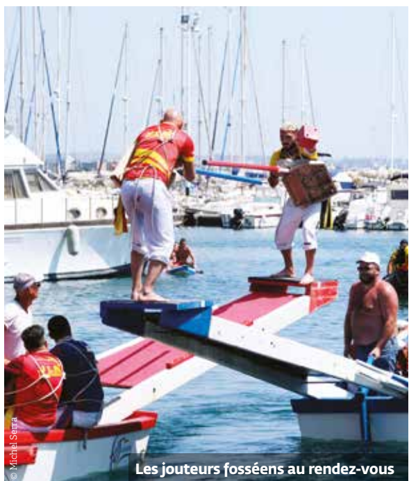
Les joueurs fosséens au rendez-vous