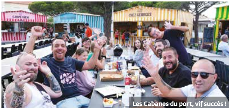
Les Cabanes du port, vif succès !