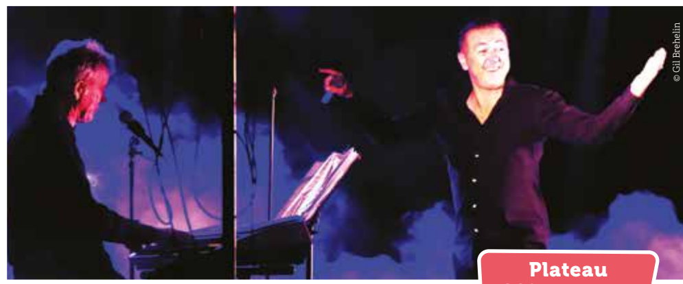
Plateau 100% Marseille