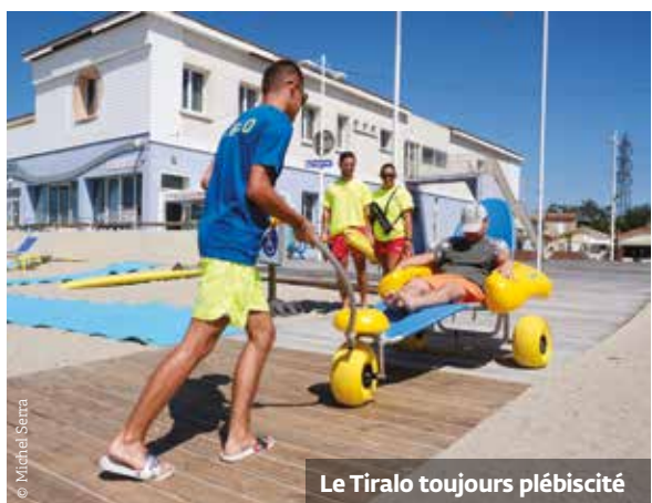
Le Tiralò toujours plébiscité