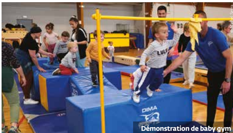
Démonstration de baby gym

DEVOIR DE MÉMOIRE : DIMANCHE 26 MARS , René Raimondi participait aux côtés d'élus, d'anciens combattants, ainsi que des membres de l'Amicale des Pieds-noirs et leurs amis, à la commémoration de la fusillade de la rue d'Isly à Alger en 1962. Dimanche 23 avril, la commémoration organisée à l'occasion de la Journée du souvenir des victimes de la déportation a pris place devant le monument aux morts.