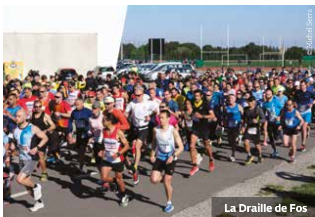
La Draille de Fos