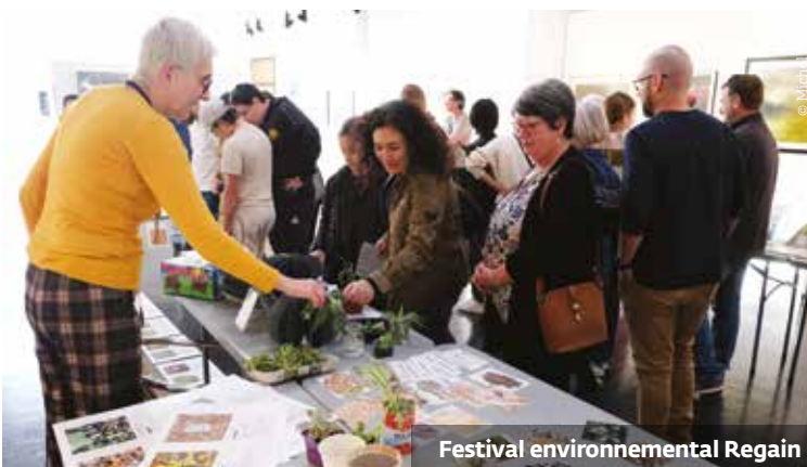
Festival environnemental Regain