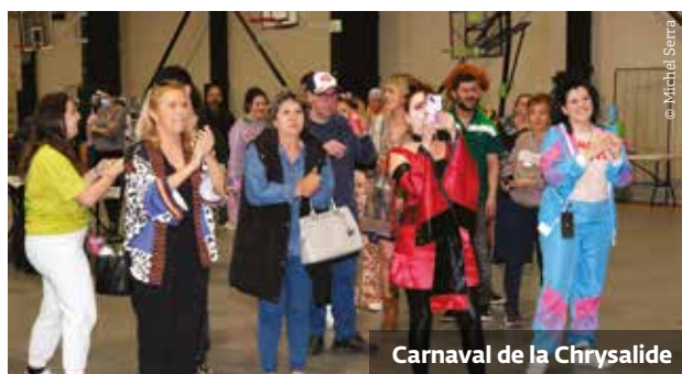
Carnaval de la Chrysalide