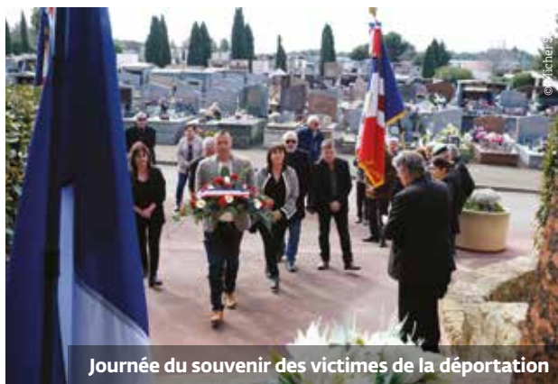
Journée du souvenir des victimes de la déportation