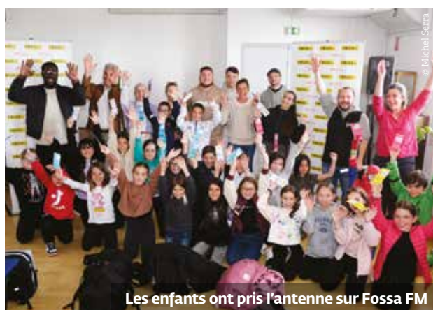
Les enfants ont pris l'antenne sur Fossa FM