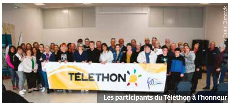
Les participants du Téléthon à l'honneur