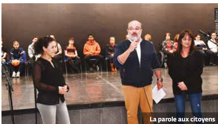
La parole aux citoyens