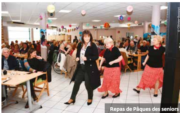
Repas de Pâques des seniors