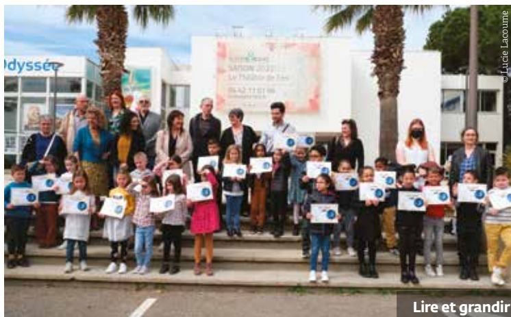
Lire et grandir

FIN 2022 , les enfants de primaire ont créé, lors des activités périscolaires et en partenariat avec Fossa FM, leur propre émission radio sur le thème des droits de l'Enfant. Mardi 11 avril, tous les participants étaient mis à l'honneur lors d'un moment convivial organisé à la Maison de la mer.