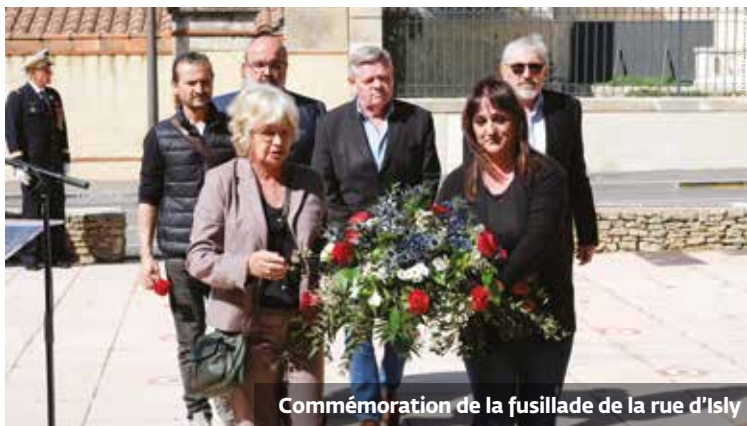
Commémoration de la fusillade de la rue d'Isly